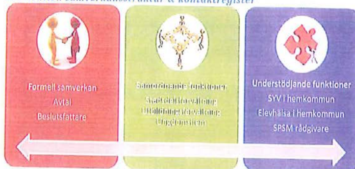
Illustration samverkansstruktur & kontaktregister

För specialpedagogiska frågor som rör elevs utbildning kan skola såväl i kommun som på ungdomshem involvera rådgivare från Specialpedagogiska skolmyndigheten (SPSM). Dessa kommer att ha en aktivt närvarande roll i arbetet med placerade barns skolgång. SPSM har i modellen utsett regionala samordnare som kommer att handlägga förfrågan om stöd från kommuner eller ungdomshem. SPSM definieras också som en understödjande part i modellen.